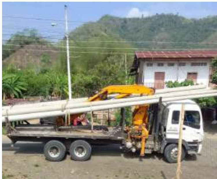
Construcción de línea de conducción eléctrica