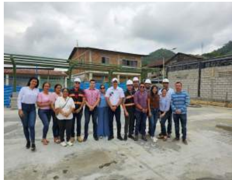
Mercado de Alhajuela