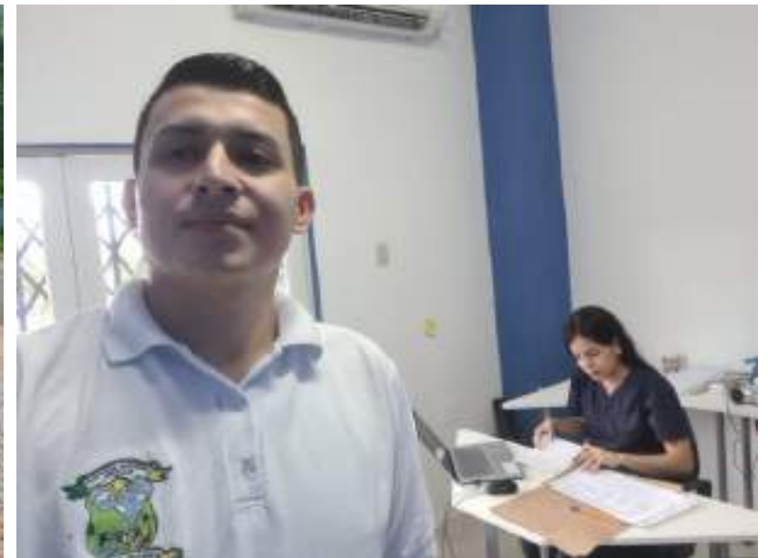
Servicio de fisioterapia