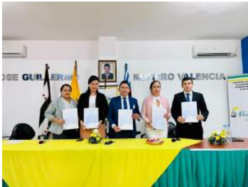
Posesión de autoridades