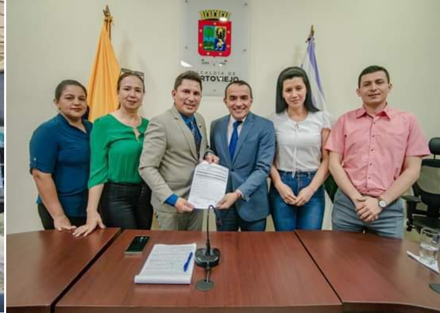
Gestiones con la Alcaldía de Portoviejo