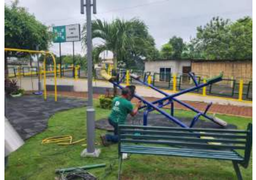
Administrador – Mantenimiento al Parque