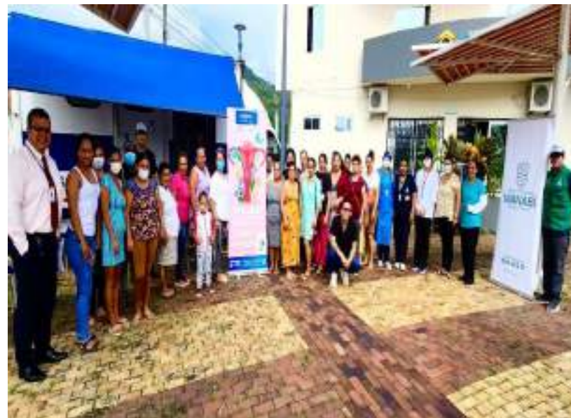
Jornadas de Papanicolao