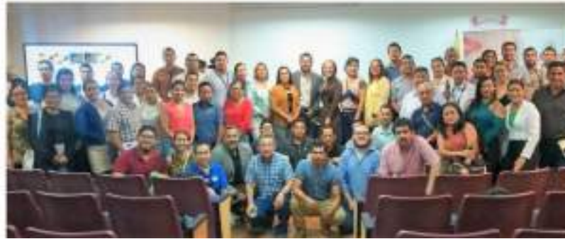
Reunión de Planificación

Gobiernos locales de Manabí se capacitaron en planificación y ordenamiento territorial