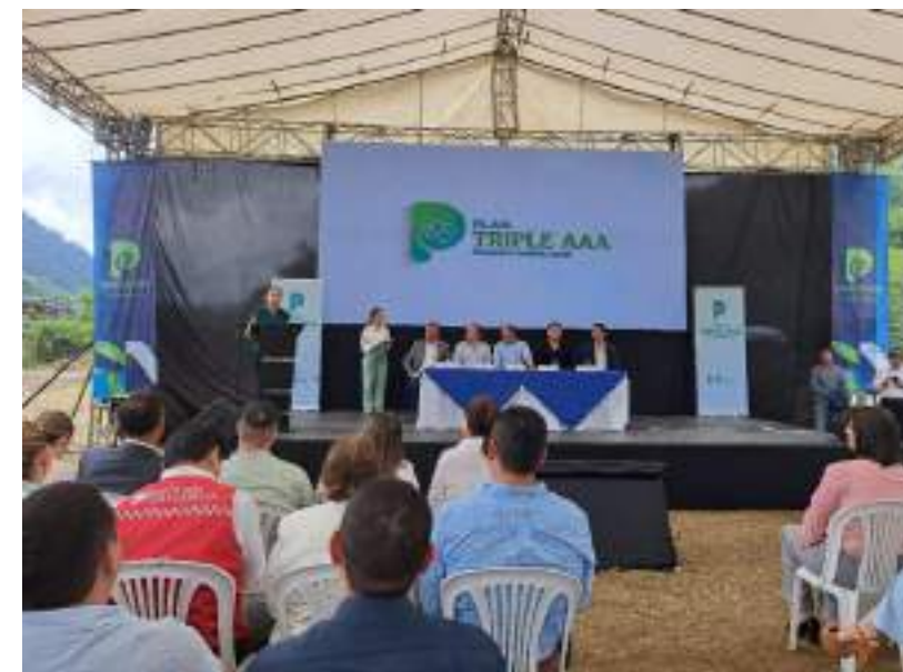
Inicio de Obra de agua potable