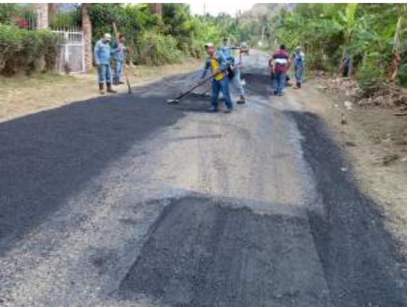
Mantenimiento vial en Cascabel