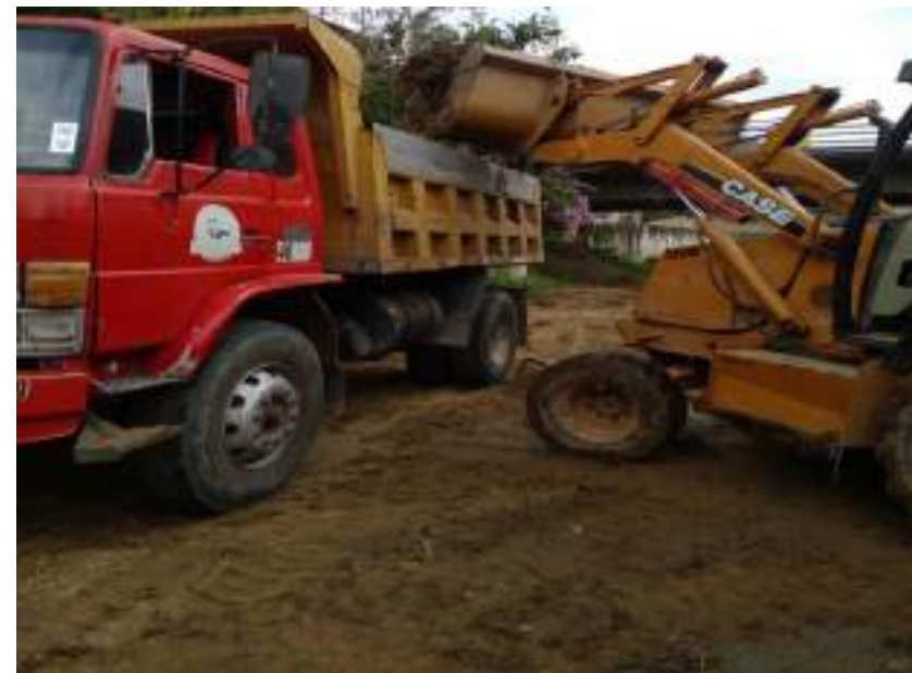
Limpieza y desazolve en el canal principal