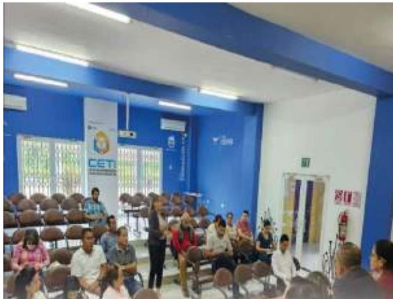
Actualización de los instrumentos de planeamiento urbanístico