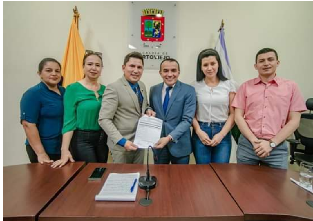
Seguimiento a gestiones con la Alcaldía