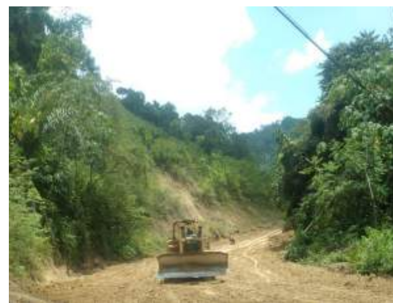
Seguimiento a trabajos de maquinarias