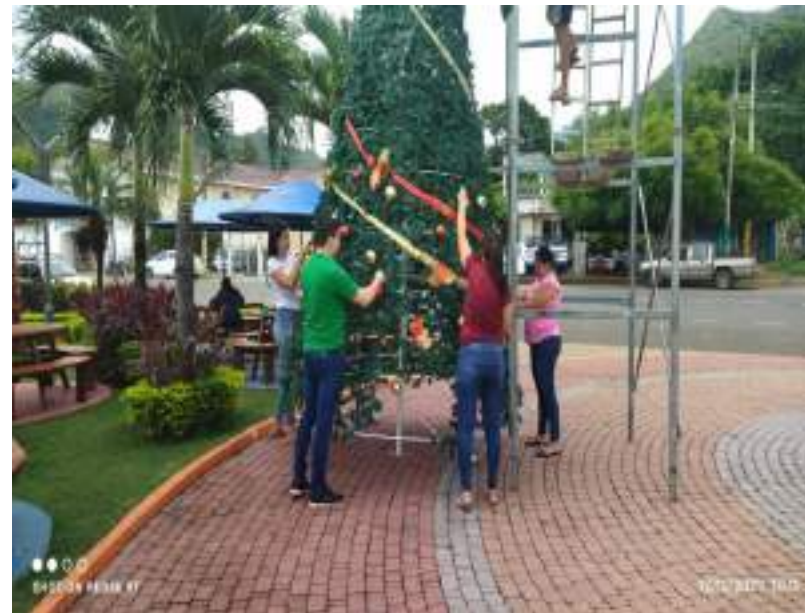
Árbol de Navidad