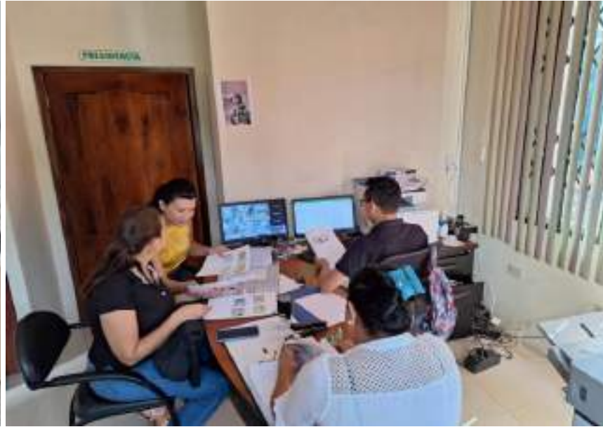
Cierre de convenios