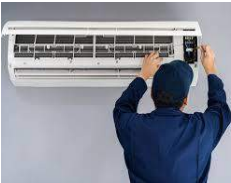
Mantenimiento a Aires acondicionado