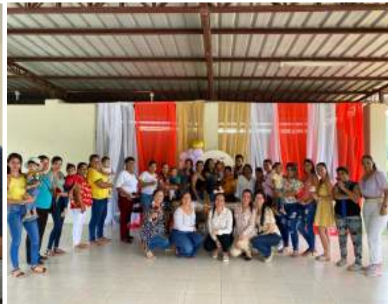
Encuentro de mujeres