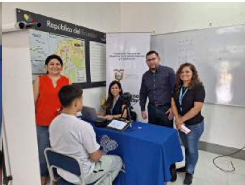
Jornada de Cedulación