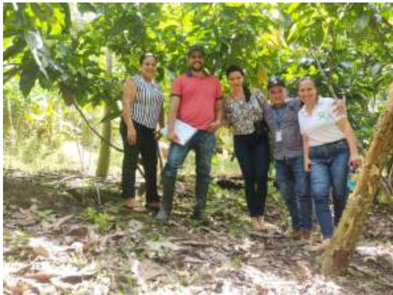
Trabajos con el MAG