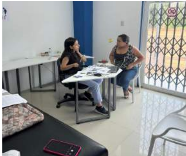
Servicio de fisioterapia