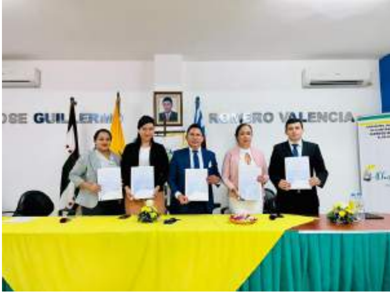
Posesión de autoridades