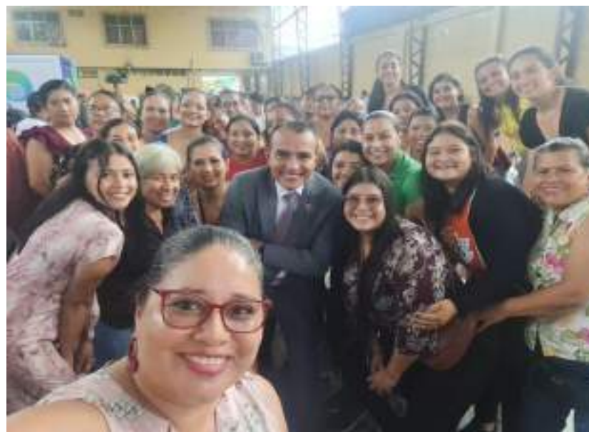
Presentación del inicio de obra del proyecto de agua Potable