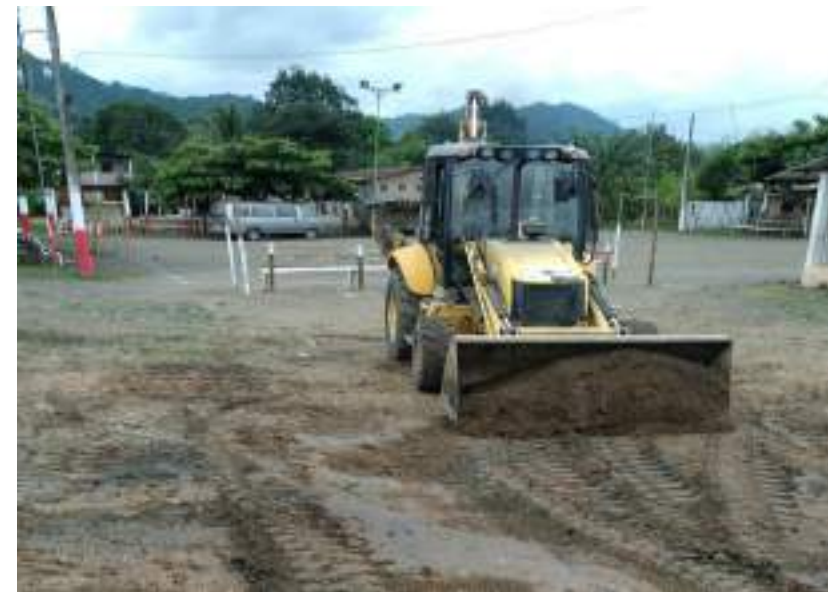
Seguimiento a trabajos de maquinarias