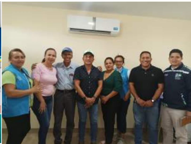
Reunión Inter parroquial frente a la llegada del fenómeno del niño