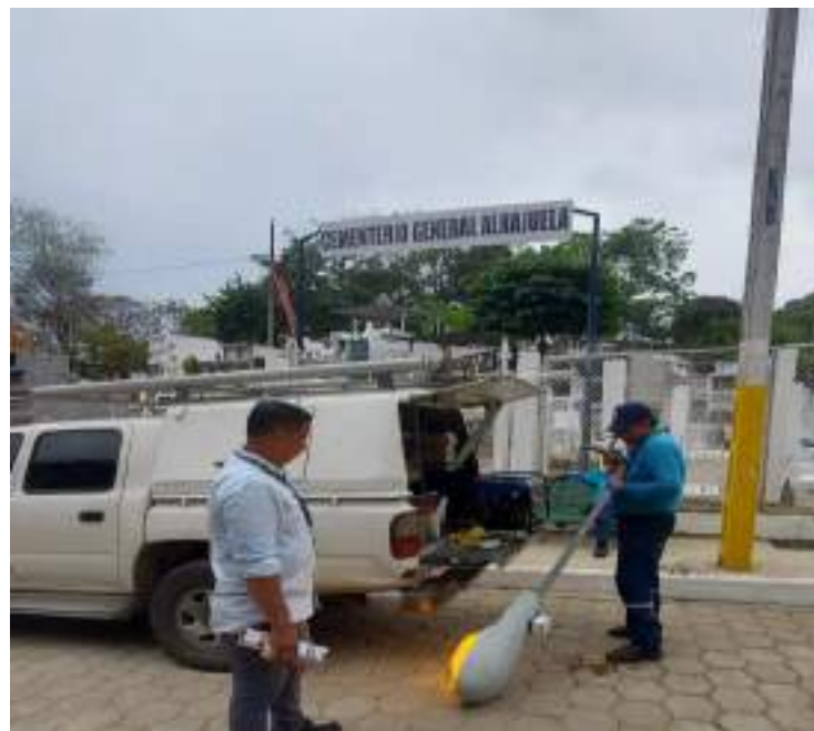
Mantenimiento a luminarias