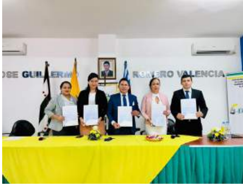
Posesión de autoridades

Gobiernos locales de Manabí se capacitaron en planificación y ordenamiento territorial