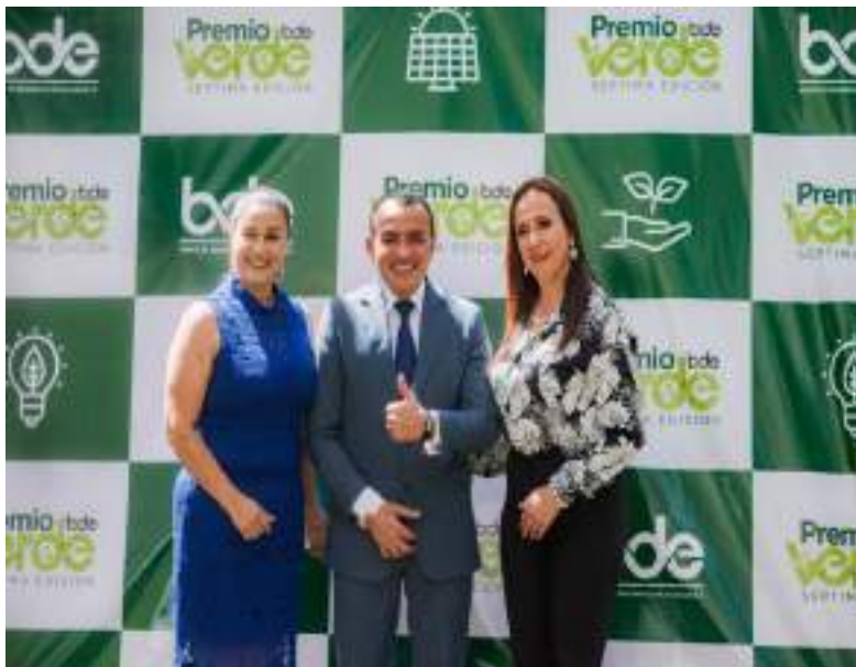
Representación Hermanas de Tierra