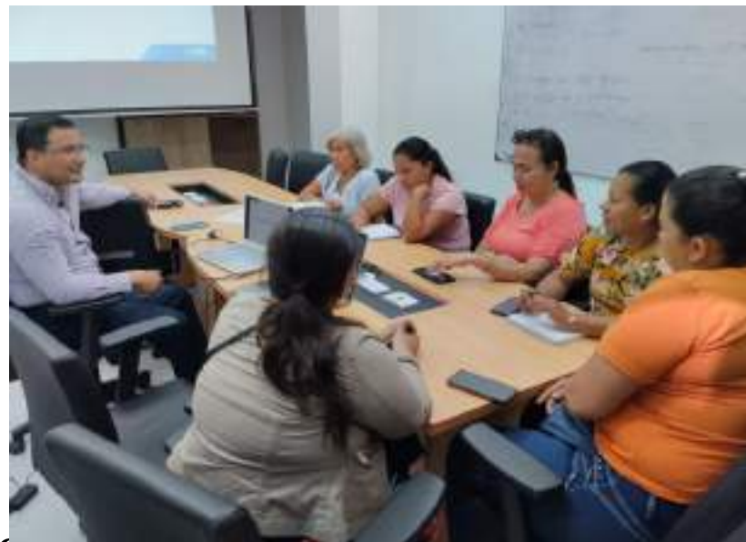
Seguimiento a proyectos Hermanas de Tierra