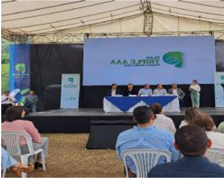
Inicio de obra proyecto de agua Potable