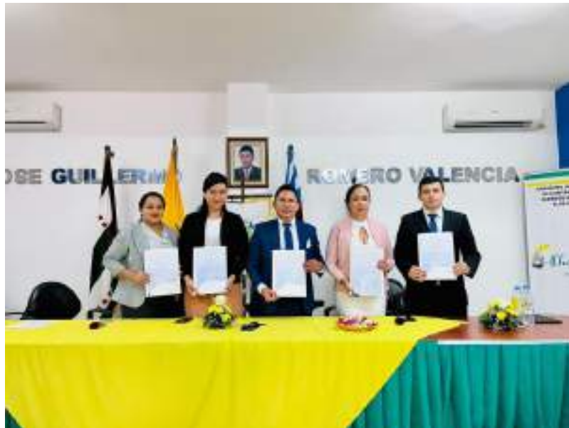
Posesión de autoridades