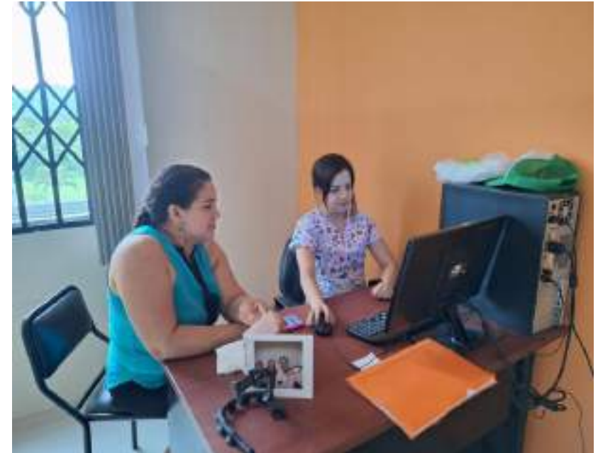
Cierre de convenios