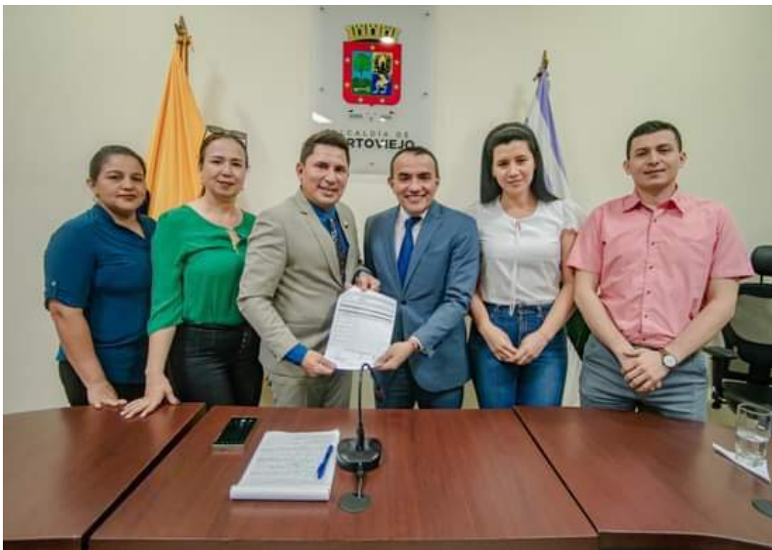
Gestiones con la Alcaldía