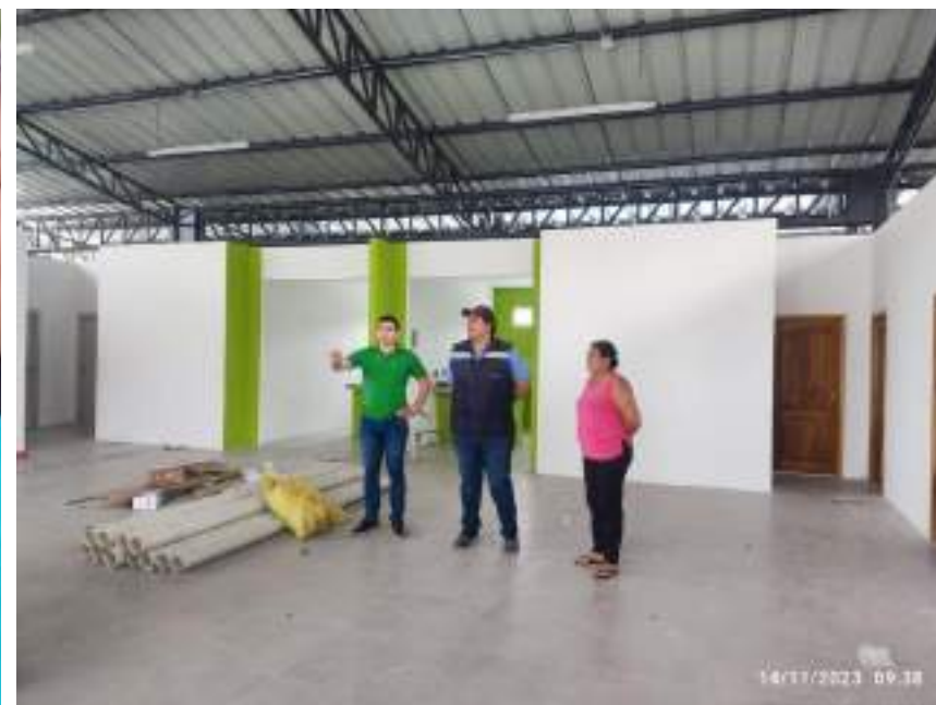
Mercado de Alhajuela