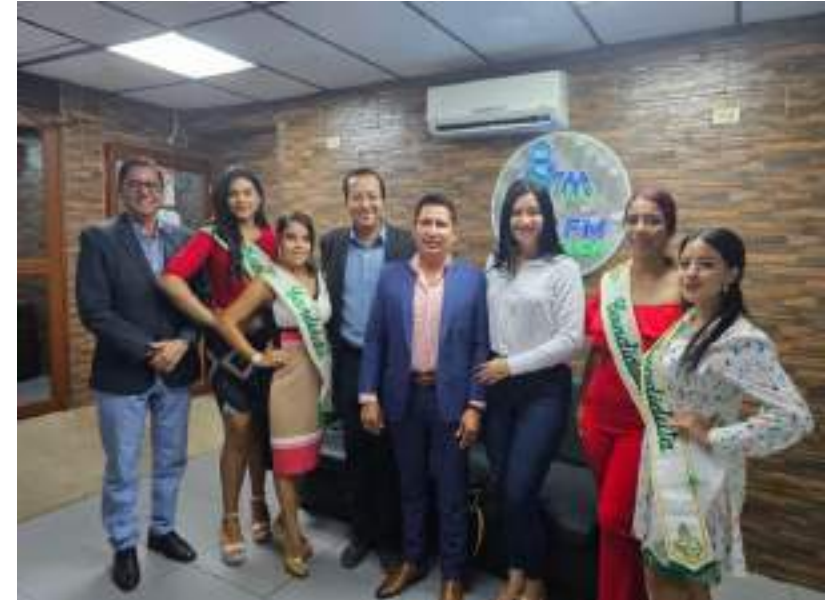
Desarrollo de las festividades de Parroquialización