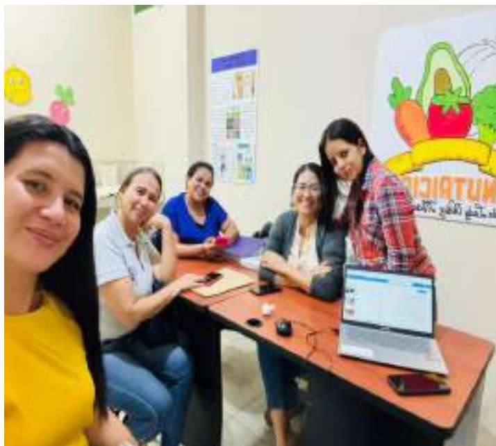
Trabajo en conjunto